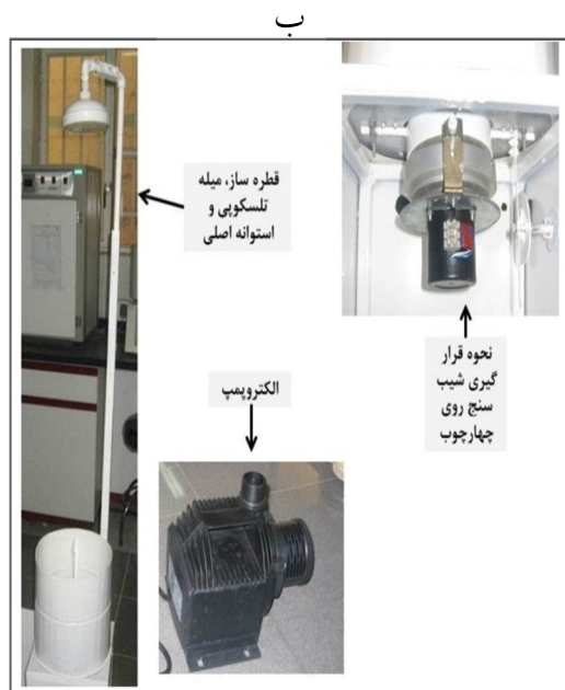
شکل ۲. دستگاه پاشمانی چند متغیره، الف: میله تلسکوپی، چهارچوب، استوانه اصلی و نمای داخلی از نحوه قرارگیری استوانه نمونه‌گیری در داخل استوانه اصلی، ب: الکترو پمپ، قطره‌ساز میله تلسکوپی و نحوه قرارگیری شیب‌سنج روی چهارچوب

برای اندازه‌گیری فرسایش پاشمانی، دستگاه پاشمانی چندمتغیره ۱ طراحی و ساخته شده است (شکل ۲). این دستگاه از سامانه شبیه ساز باران، تأمین شیب و حرکت چرخشی نمونه تشکیل شده است. سامانه شبیه‌سازی باران شامل پمپ الکتریکی، لوله‌های تلسکوپی، شیر کنترل کننده دبی و نازل می‌باشد. به منظور ایجاد همپوشانی کامل باران با نمونه خاک با توجه به ابعاد سیلندر حاوی نمونه (۱۰×۱۰ سانتی متر طبق الگوی 1981 Morgan ) قطر شبکه نازل ۱۵ سانتی متر در نظر گرفته شد. از سیستم تأمین شیب برای تولید شیب مورد نظر و زاویه دادن به استوانه حاوی نمونه و از سیستم حرکت چرخشی نمونه (به وسیله یک دستگاه الکتروموتور) برای اینکه قطرات باران به یک نقطه اثبات نکنند، استفاده شد. این دستگاه همچنین دارای دو استوانه شامل استوانه اصلی و استوانه نمونه می‌باشد. استوانه اصلی، استوانه‌ای به ارتفاع و قطر ۳۰ سانتی متر است که استوانه نمونه با قطر ۱۰ سانتی متر داخل آن قرار می‌گیرد و فرسایش حاصل از باران ایجاد شده توسط این استوانه جمع‌آوری می‌شود. این استوانه توسط دو تیغه به دو بخش بالای شیب و پایین شیب تقسیم شده است که می‌تواند پاشمان در بالادست و پایین دست شیب را تفکیک کند. در کف استوانه اصلی در هر یک از بخش‌های بالای شیب و پایین شیب، سوراخ‌هایی تعبیه شده که خاک پاشمان شده حاصل در بالا دست و پایین دست شیب را به طور مجزا جمع‌آوری می‌کنند. بنابراین با این دستگاه می‌توان، نرخ کل فرسایش پاشمانی، فرسایش پاشمانی بالادست شیب و پایین دست شیب را در شیب‌های مختلف بر روی خاک‌های دست خورده و دست نخورده اندازه‌گیری نمود.