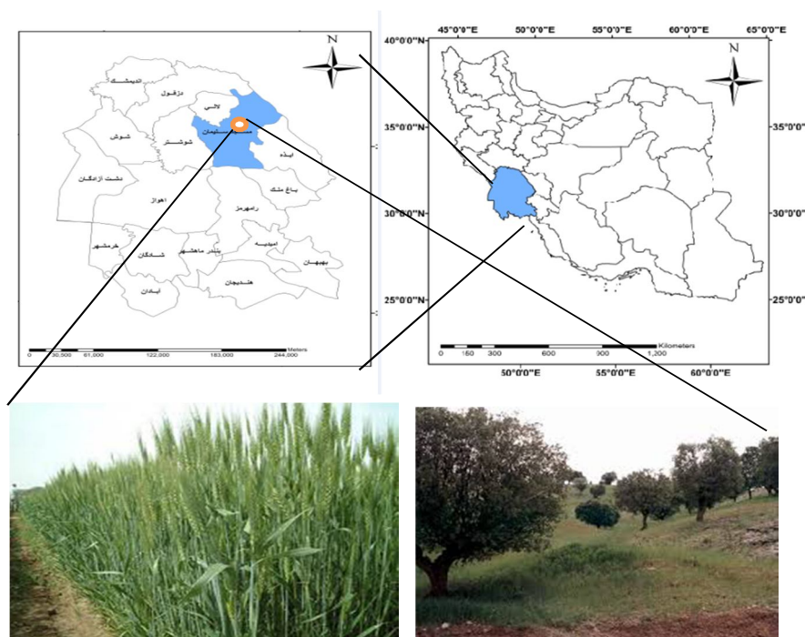
شکل ۱. موقعیت جغرافیایی منطقه مورد مطالعه و کاربری‌های مختلف

پوشش گیاهی طبیعی منطقه، جنگل‌های بلوط است که به دلیل سوء مدیریت به شدت تخریب شده است. کاربری کشاورزی نیز عمدتاً کشت گندم دیم است. نمونه‌ها به آزمایشگاه انتقال یافته و پس از هوا خشک شدن به دو قسمت تقسیم گردیدند: یک قسمت برای انجام آزمایش‌های فیزیکی و شیمیایی مختلف از الک ۲ میلی‌متری عبور داده شد و قسمت دیگر آن، برای اندازه‌گیری میزان فرسایش پاشمانی از الک ۸ میلی‌متری عبور داده شد.