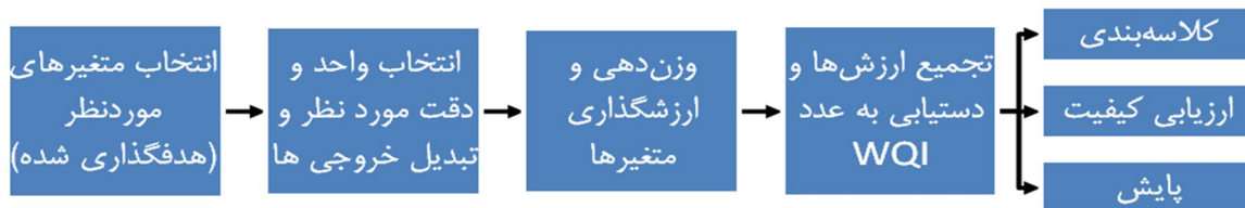
شکل ۲. فرایند انتخاب مدل شاخص-محور کیفی و خروجی‌های آن

بطور کلی رویکرد انتخاب مدل ارزیابی کیفی آب، متکی بر فرایند ارائه شده در شکل ۲ می باشد. با توجه به مشخصات ذکر شده در جدول ۱ و سوابق مدل‌های کیفی پیشنهاد شده توسط مراجع مختلف و نیز با در نظر گرفتن