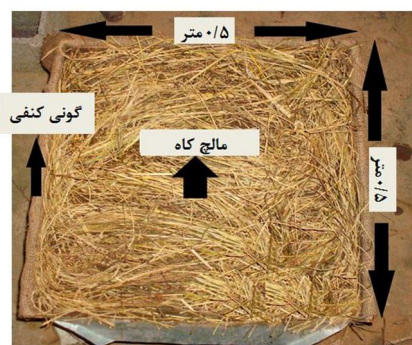
شکل ۲. نمایی از کورت فرسایشی پوشیده شده با کاه و کلش برنج مورد استفاده در پژوهش

پژوهش حاضر به سبب امکان پایش دقیق رواناب و هدررفت خاک و جمع‌آوری داده (Miyata et al., 2009+2011) در آزمایشگاه شبیه‌ساز باران و فرسایش خاک دانشکده منابع طبیعی دانشگاه تربیت مدرس صورت گرفت. به همین منظور پس از آماده‌سازی اولیه کورت‌های آزمایشی، به منظور تأمین شرایط رطوبت ظرفیت زراعی خاک منطقه (حدود ۲۹ درصد حجمی) به مدت ۱۵ ساعت تحت شرایط اشباع (Shoemaker, 2010) قرار گرفته و سپس به مدت ۲۴ ساعت برای خروج آب از خاک زمان داده شده و در نهایت رطوبت باقی مانده به عنوان رطوبت ظرفیت زراعی خاک مد نظر قرار داده شد (Kukul and Sarkar, 2011). سپس کاه و کلش برنج هواخشک به وزن ۱۲۵ گرم بر سطح خاک کورت و منطبق بر مطالعات پیشین (Gholami et al., 2013) و امکان اجرای عملی آن در شرایط واقعی پخش گردید، به‌گونه‌ای که در حدود ۹۰ درصد از سطح کورت (Das and Agrawal, 2002؛ Adekalu et al., 2007؛ Gholami et al., 2013؛ Kukul and Sarkar, 2011) پوشیده شد. نمای کلی از کورت فرسایشی مورد استفاده و جزئیات مربوط به آن در شکل ۲ نشان داده شده است. همچنین کورت شاهد (خاک لخت) تحت شرایط مشابه با تیمارهای مطالعاتی آماده‌سازی شد. در این آزمایش از چهار تیمار شامل دو تیمار شدت بارندگی، یک تیمار حفاظتی با کاه و کلش برنج و یک تیمار شاهد و فاقد پوشش حفاظتی با سه تکرار استفاده شد.